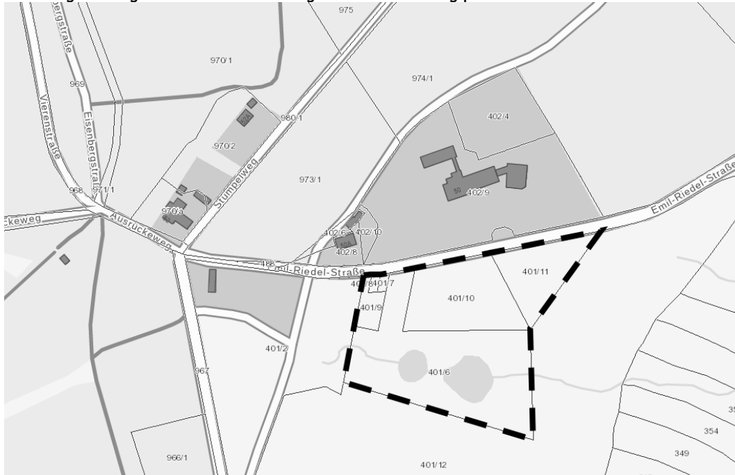
Abbildung: Geltungsbereich der 3. Änderung des Flächennutzungsplans

Der Geltungsbereich wird als unterbrochene Liniensignatur dargestellt.