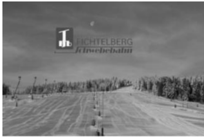
Herbstrevision Fichtelberg Schwebebahn (In diesem Zeitraum ist kein Fahrbetrieb möglich.) 01.11.2021 - 16.11.21