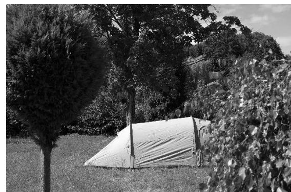
Beispiel eines Trekkingplatzes

Du solltest nicht weiter als drei Kilometer vom Weg entfernt leben oder einen Hol- und Bring-Service anbieten.