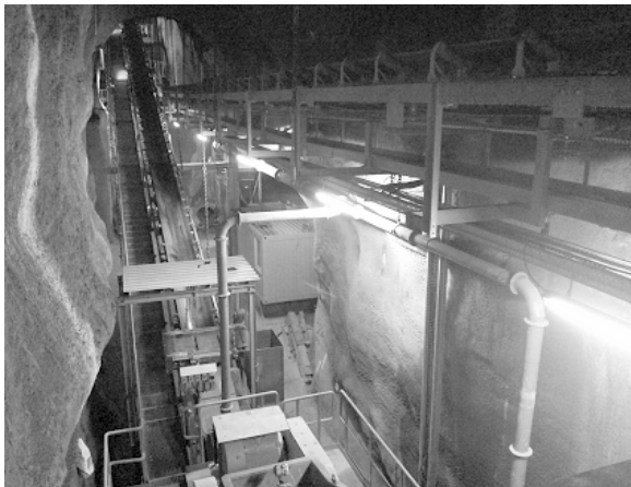
Band- und Sortieranlage unter Tage

In den vergangenen Jahren investierte das Unternehmen zusammen mit seinem Gesellschafter, der Nickelhütte in Aue, rund 25 Millionen Euro in die Vorbereitung der Rohstoffförderung. Insgesamt wurden Gänge mit einer Gesamtlänge von rund 2,5 km in den Berg gesprengt. Die Zufahrtsrampe wurde unter Tage mit einer Größe von rund 5 x 5 Metern konzipiert, so dass Lastkraftwagen direkt im Berg mit den Rohstoffen beladen werden können. Hierzu wurde eine riesige Band- und Sortieranlage unter Tage eingebaut, die mittels Röntgenstrahlen eine Vorsortierung der Rohstoffe vornehmen soll. Der entstehende Abraum soll später im Berg verbleiben und zur Verfüllung ausgebeuteter Gänge dienen. Es ist geplant, jährlich rund 135.000 Tonnen Fluss- und Schwerspat, aber auch Kupfer/Blei-Sulfiderze in die Nickelhütte nach Aue zur Aufbereitung zu transportieren. Derzeit finden durch das neue Bergwerk allein beim Unternehmen EFS GmbH siebenunddreißig Menschen Arbeit, ein Ausbau auf rund fünfundvierzig Mitarbeiter ist geplant. Etwa neunzig Prozent der Mitarbeiter wohnen in den Städten und Gemeinden rund um das neue Bergwerk.