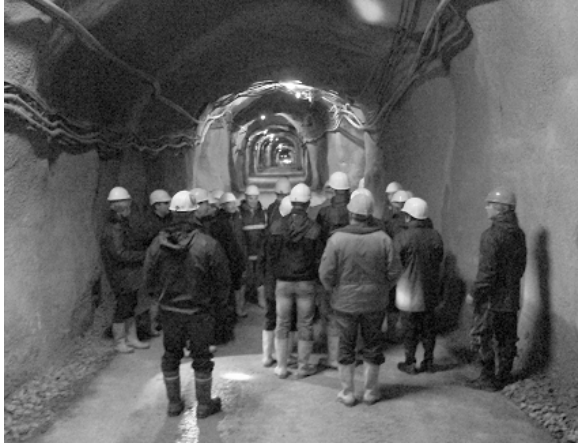
Besucherführung über den etwa 5 x 5 m großen Haupteingang am 08.11.2013 ins Berginnere

In den vergangenen Jahren investierte das Unternehmen zusammen mit seinem Gesellschafter, der Nickelhütte in Aue, rund 25 Millionen Euro in die Vorbereitung der Rohstoffförderung. Insgesamt wurden Gänge mit einer Gesamtlänge von rund 2,5 km in den Berg gesprengt. Die Zufahrtsrampe wurde unter Tage mit einer Größe von rund 5 x 5 Metern konzipiert, so dass Lastkraftwagen direkt im Berg mit den Rohstoffen beladen werden können. Hierzu wurde eine riesige Band- und Sortieranlage unter Tage eingebaut, die mittels Röntgenstrahlen eine Vorsortierung der Rohstoffe vornehmen soll. Der entstehende Abraum soll später im Berg verbleiben und zur Verfüllung ausgebeuteter Gänge dienen. Es ist geplant, jährlich rund 135.000 Tonnen Fluss- und Schwerspat, aber auch Kupfer/Blei-Sulfiderze in die Nickelhütte nach Aue zur Aufbereitung zu transportieren. Derzeit finden durch das neue Bergwerk allein beim Unternehmen EFS GmbH siebenunddreißig Menschen Arbeit, ein Ausbau auf rund fünfundvierzig Mitarbeiter ist geplant. Etwa neunzig Prozent der Mitarbeiter wohnen in den Städten und Gemeinden rund um das neue Bergwerk.