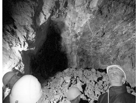
Der ca. 80 cm breite Spatgang in der Bildmitte, Foto: Mirko Ernst

Das Flussspatvorkommen der gesamten Lagerstätte auf deutscher und tschechischer Seite wird auf rund drei Millionen Tonnen geschätzt. Die Grube könnte damit voraussichtlich 25 Jahre lang in Betrieb bleiben. Der Flusspat ist dabei das Hauptprodukt, welcher vor allem in der Metallurgie und der chemischen Industrie als Säurespat eingesetzt wird. Letztendlich entstehen daraus solche hochwertigen Produkte wie Gore-Tex und Teflon. Das zweite Produkt, der Schwerspat, dient vor allem als Füllstoff bei der Papierproduktion und als Barium-Lieferant in der chemischen Industrie.